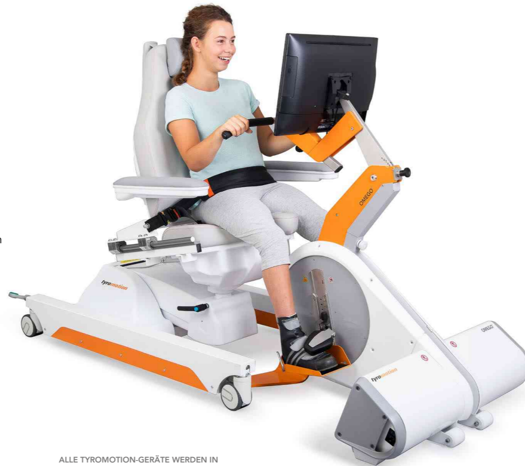
ALLE TYROMOTION-GERÄTE WERDEN IN DER EU ENTWICKELT UND HERGESTELLT.