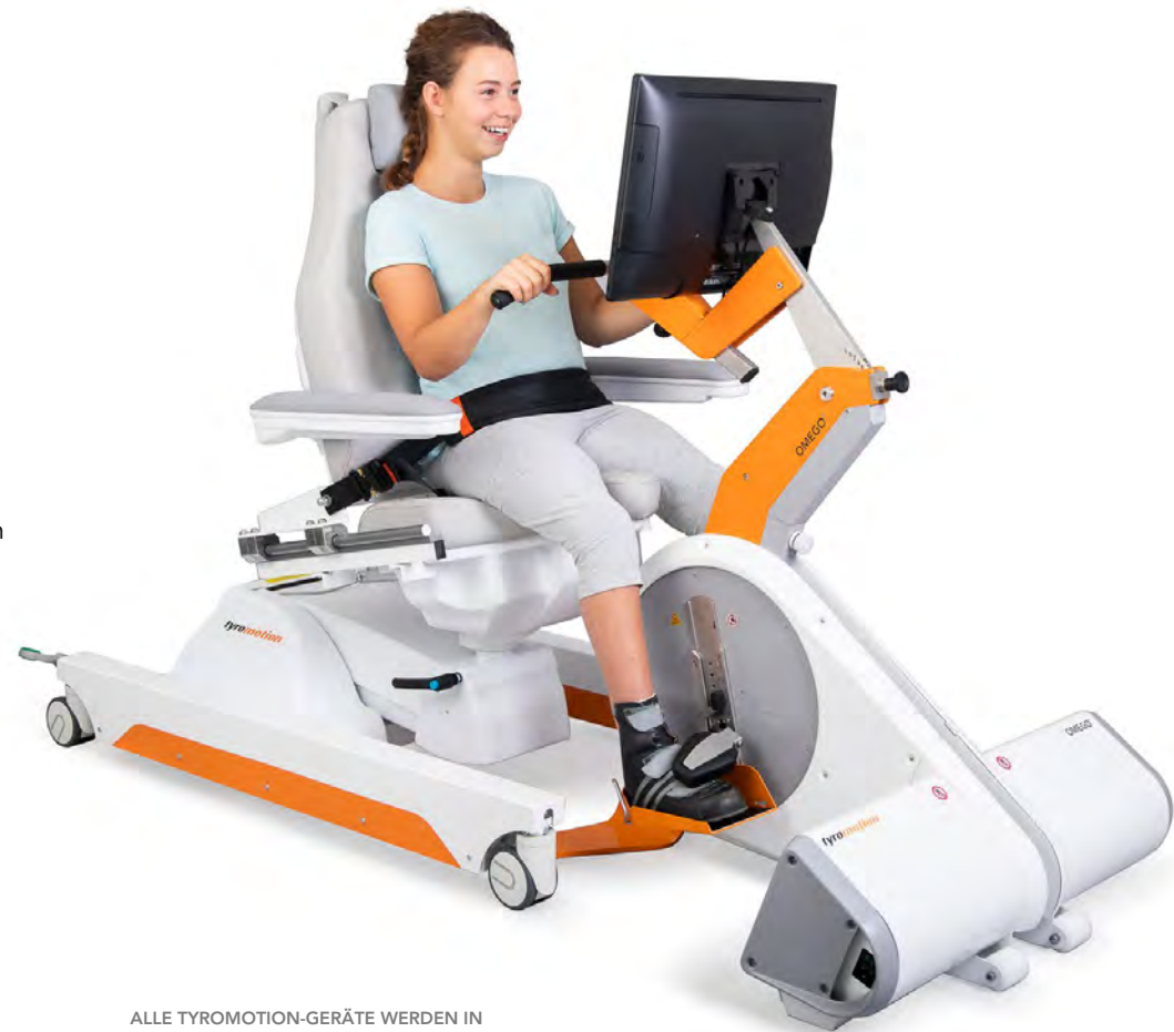
ALLE TYROMOTION-GERÄTE WERDEN IN DER EU ENTWICKELT UND HERGESTELLT.